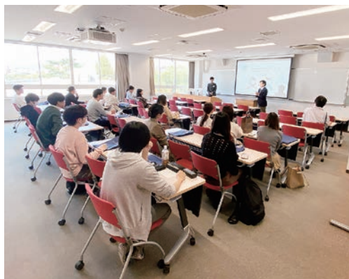
2025年度参加の監査法人は、有限責任あずさ監査法人、PwC Japan有限責任監査法人、仰星監査法人、EY新日本有限責任監査法人、三優監査法人、有限責任監査法人トーマツ、太陽有限責任監査法人の7社でした。

いずれも、多岐にわたる業務の内容や採用情報について、現場で活躍されている方々の生の声を聞くことができる絶好のチャンスです。事前申し込みは不要の説明会ですので、専門スキルを活かして働きたいと考えている皆さんは自由に参加できます。