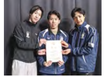
▲アイススケート団体