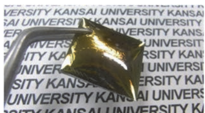
チタニア基ハイブリッド材料 (シリコン基板上) 屈折率1.70